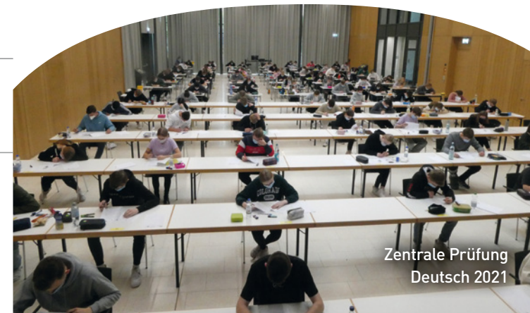
Zentrale Prüfung Deutsch 2021