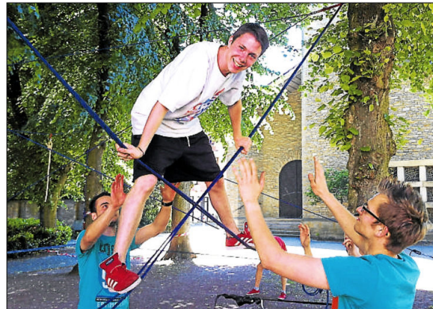
Die Mindful-Jugendhilfe bietet beim Boys' Day einen erlebnispädagogischen Workshop nur für Jungen an.